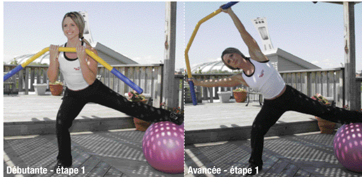
Débutante - étape 1