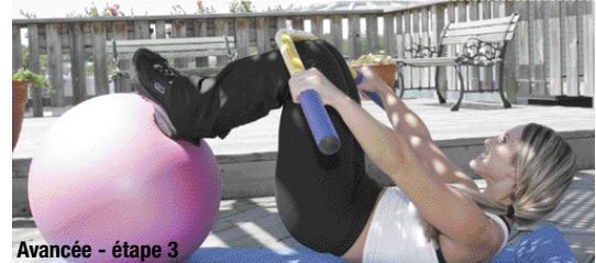
Avancée - étape 3

Intermédiaire-avancée: Placez votre barre au-dessus de votre tête. Tout en demeurant sur le dos, placez vos pieds environ à 10 pouces de distance afin d'être bien stable. Rallongez les jambes, soulevez le corps. Simultanément, lorsque vous tirez les genoux vers la poitrine, ramenez votre barre au-dessus de ceux-ci pour ensuite retourner le bassin au sol et la barre au-dessus de votre tête.