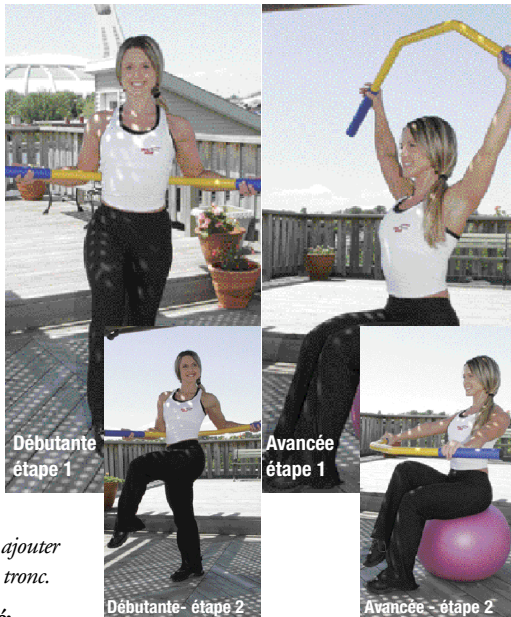
Débutante étape 1

Assis sur un ballon, vous pouvez conserver les bras en flexion avec la barre, ou encore en débutant avec la barre au-dessus de votre tête, ramener la barre au genou à chaque fois que celui-ci fléchit.