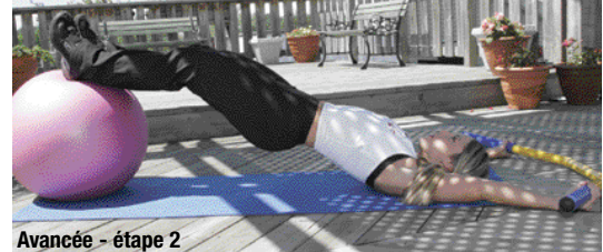
Avancée - étape 2