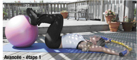
Avancée - étape 1