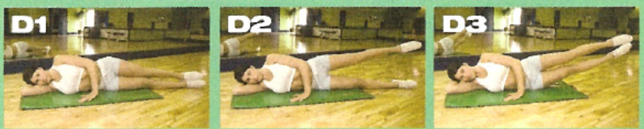
PLANCHE DE CÔTÉ - SUR LE COUDE - AVEC ABDUCTION DE LA JAMBE